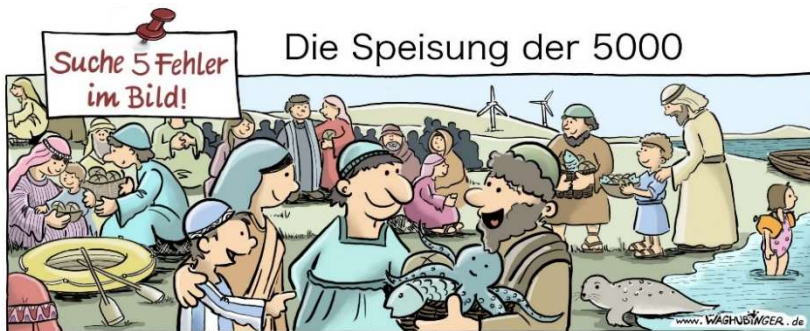
Schlauchboot, Tintenfisch, Windräder, Windmäder, Robbe, Schwimmitlügel

Bitte beachten Sie: Der Kindergottesdienst findet seit Januar 2025 am letzten Sonntag im Monat um 11.15 Uhr in der Pauluskirche statt. In den Ferienzeiten findet meistens kein Kindergottesdienst statt. Bitte beachten Sie die Infos im Kommunal-Echo oder auf unserer Homepage. Bei der Verabschiedung erwähnte ich auch meine eigenen sehr positiven Erfahrungen mit dem Kindergottesdienst in meiner Kindheit. Ich kann Sie also gerne dazu ermutigen, auch Ihre Kinder in den Kindergottesdienst zu bringen. Der Glaube an Gott kann immer wieder positive Erfahrungen auf verschiedenen Ebenen ermöglichen.