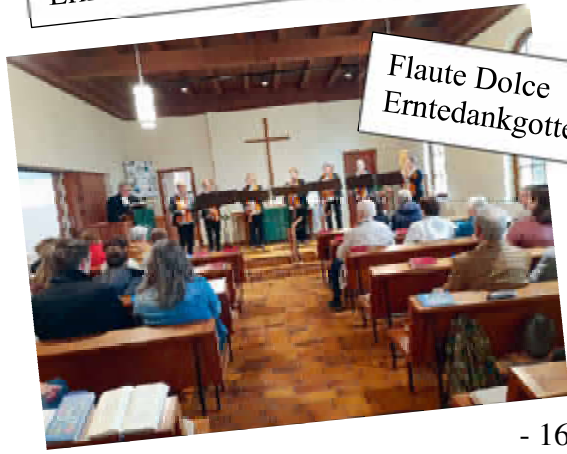
Flaute Dolce Erntedankgottesdienst