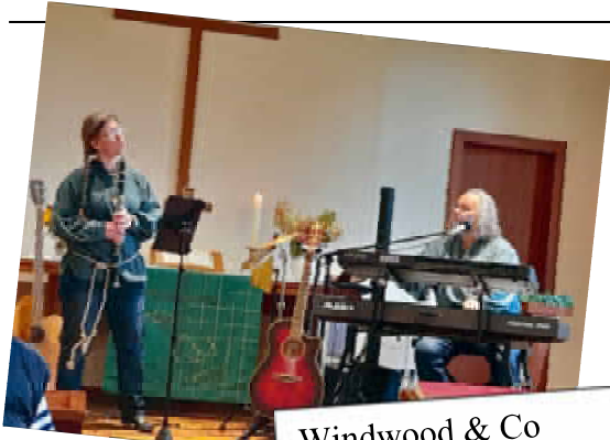
Windwood & Co Konzertgottesdienst 13.10.2024 Geschichte von Rut und Boas