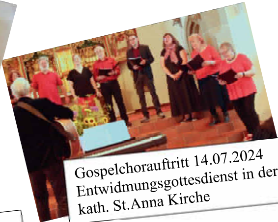
Gospelchorauftritt 14.07.2024 Entwidmungsgottesdienst in der kath. St. Anna Kirche