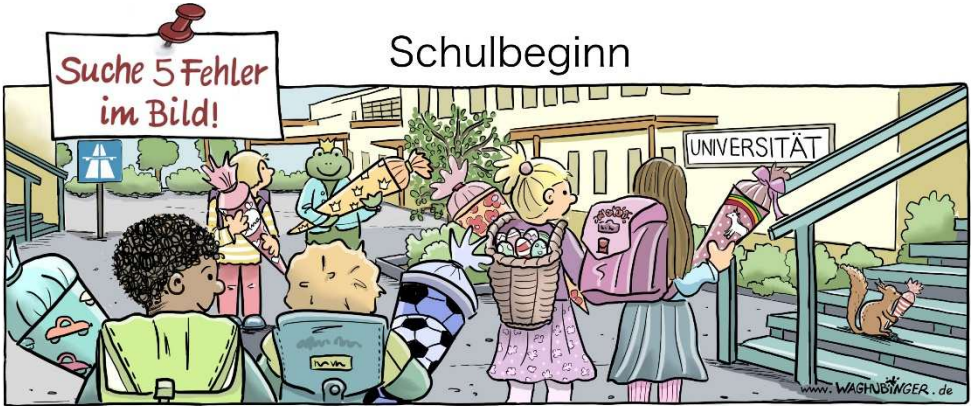
Autobahnschild, Frosch, Korb mit Ostereiern, "Universität", "Eichhörnchen